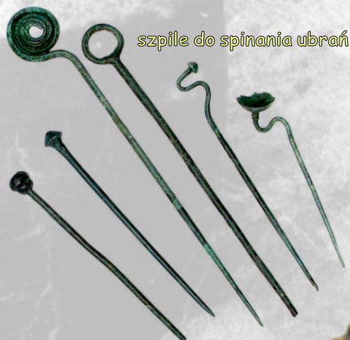
szpile do spinania ubrań